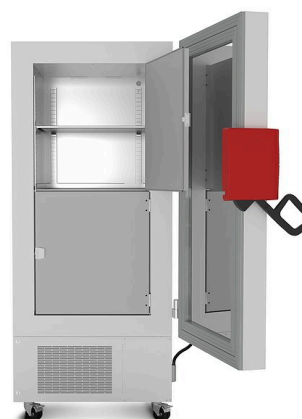
Modell UF V 500