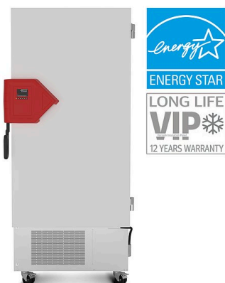
Modell UF V 500